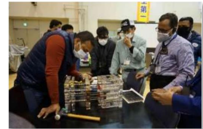
日本での金型技術の向上研修の様子

概要 | ビジネス環境整備、投資促進に資する経済特区開発促進 、及び 産業振興 に係る施策の立案・実施、実施体制の強化により、外国直接投資と国内産業の連関の強化を図り、もって同国内の産業の多角化及び高度化に寄与